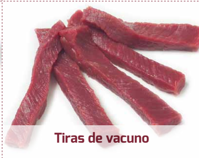
Tiras de vacuno