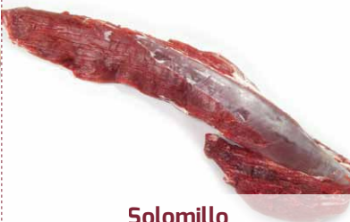
Solomillo < 2,700 Kg