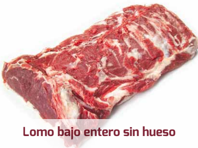
Lomo bajo entero sin hueso