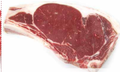
Chuletón cortado 325 ± 25 / 400 ± 50 / 500 ± 50 gr