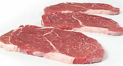
Bistec cortado 70-100 / 120 ± 15 / 150 ± 15 gr