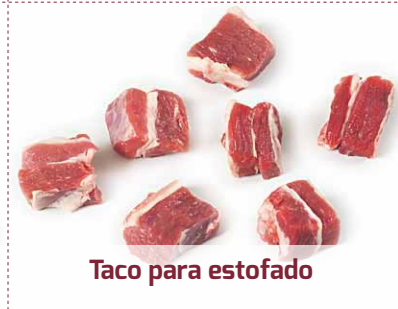
Taco para estofado