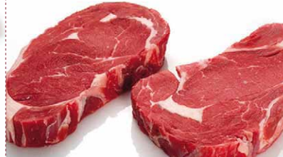
Entrecot sin hueso 200 / 250 / 300 / 350 ± 25 gr