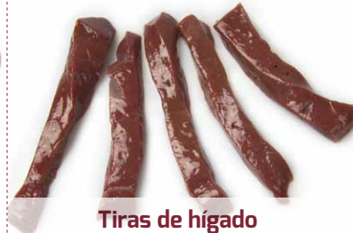
Tiras de hígado