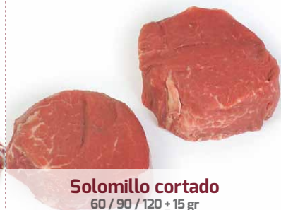
Solomillo cortado 60 / 90 / 120 ± 15 gr