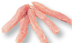
Tiras (paletilla) Shoulder strips Émincés d'épaule