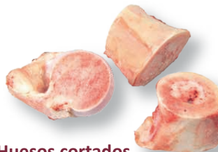
Huesos cortados Marrow bones Os coupé