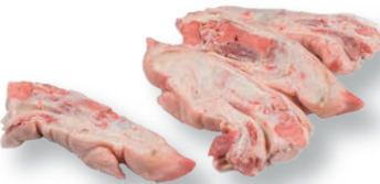
Pies partidos Pig's trotters cut in halves Pieds coupé en deux