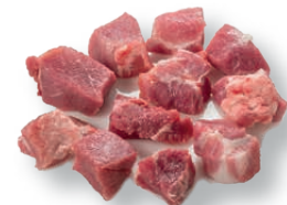
Tacos para estofado (paletilla) Diced shoulder for stew Sauté d'épaule pour ragoût