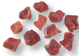
Tacos de ovino para estofado Diced ovine for stew Sauté d'ovine pour ragoût