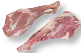
Pierna de cabrito Kid leg Gigot de chevreau