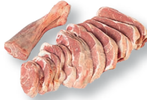
Pierna de cordero cortada Sliced lamb leg Gigot d'agneau tranché