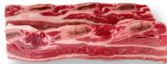
Churrasco de falda "Churrasco" from flank "Churrasco" du flanchet