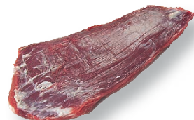
Aleta limpia (vacío limpio) Flank steak Bavette de flanchet