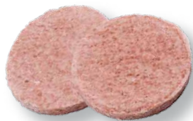
Burger vegetal Vegetal burger Burger végétal