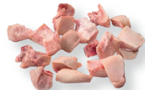
Morro crudo cortado Diced raw snout Museau cru coupé