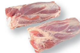
Codillos partidos Hock cut in halves Jarret coupé en deux