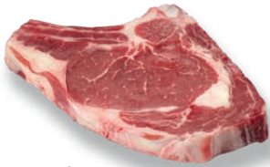
Chuletón Rib steak Côte