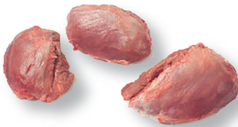
Carrillada sin hueso Boneless cheek Joues sans os