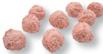
Pelotas vegetales Vegetal meatballs Boulettes végétal