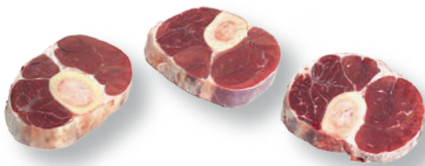
Ossobuco cortado Sliced ossobuco Ossobuco coupé