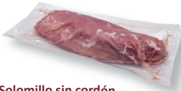
Solomillo sin cordón Tenderloin chain-off Filet mignon sans chaîne