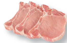
Centro de chuleta Loin chops Côtelettes de longe