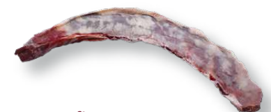
Entrama fina Thin flank Bavette d'loyau