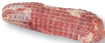
Redondo atado Chuck round Rôti de paleron ficelé