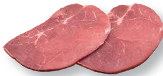
Bistec de ternera Veal steak Steak de veau