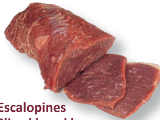
Escalopines Sliced knuckle Mouvant tranché