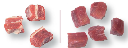
Tacos magros (falda) | Tacos (pecho) Diced flank | Diced breast Sauté de flanchet | Sauté d'avant