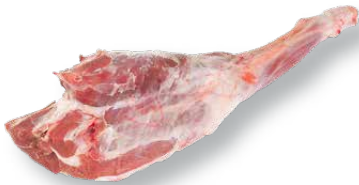
Pierna de cordero Lamb leg Gigot d'agneau