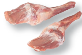
Paletilla de cabrito Kid shoulder Épaule de chevreau