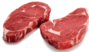
Rib eye sin hueso Boneless rib eye steak Entrecôte sans os