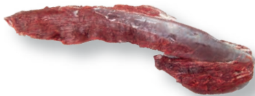
Solomillo sin cordón Tenderloin chain-off Filet sans chaîne