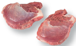
Carrillada con hueso Bone-in cheek Joues avec os