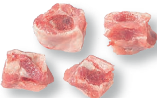
Tacos de costilla Cutted spare ribs Côtelettes coupés