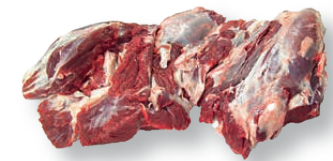
Morcillo de paletilla deshuesado Boneless fore shank Jarret d'épaule désossé