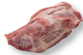
Cabeza de lomo sin hueso Boneless collar Échine désossé