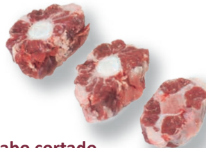
Rabo cortado Sliced tail Queue coupé