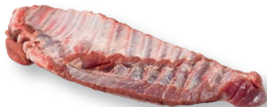
Costilla entera Whole spare ribs Plat de côtes