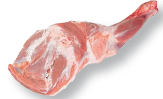
Paletilla de cordero Lamb shoulder Épaule d'agneau