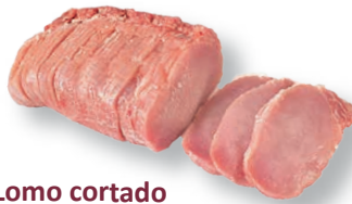
Lomo cortado Sliced loin Longe tranché