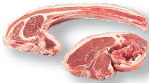
Chuletas de cordero Lamb chops Côtelettes d'agneau