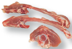
Chuletas de cabrito Kid chops Côtelettes de chevreau