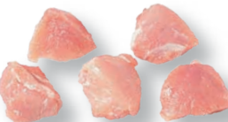
Tacos magros para estofado Diced stew pork lean Sauté maigre pour ragoût