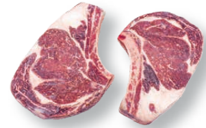
Chuletón Black Angus Black Angus rib steak Côte Black Angus