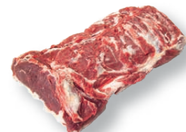
Lomo bajo deshuesado Boneless sirloin Faux-filet désossé