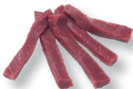
Tiras de la babilla Knuckle strips Émincés de mouvant