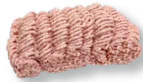
Picada vegetal Vegetal mince Hachée végétal