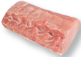
Lomo entero sin cordón Whole loin chain-off Longe entière sans chaîne