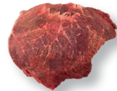
Carrillada sin hueso Boneless cheek Bajoue sans os